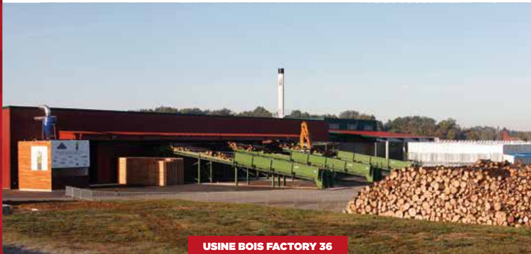
USINE BOIS FACTORY 36

Proche du lieu du colloque (précisions pour les inscrits à venir)